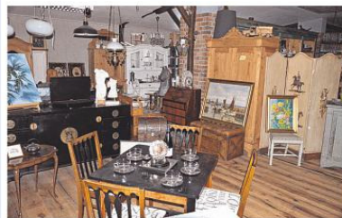
In der großen Möbel-Trödel-Halle wird es weiterhin antike Raritäten von Jugendstil bis Bauernmöbeln und anderen ausgefallenen Spezialitäten geben.

tags, mittwochs und donnerstags von 8.00 - 16.30 Uhr. Telefon: 04661/93 77 45 E-Mail: mail@flinker-friese.de www.flinker-friese.de