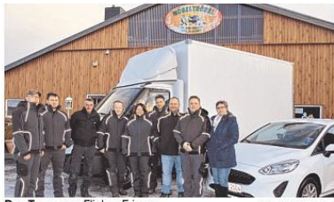
Das Team vom Flinken Friesen.